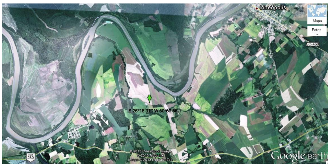
Figura 1 - Localização da área experimental através de imagem de satélite. Irineópolis, SC.

O experimento foi conduzido na Fazenda Escada, situada no município de Irineópolis – SC ( -26^{\circ}16'31'' S; -50^{\circ}50'55,1'' W), em uma altitude de 796 metros (Figura 1). O clima da região é do tipo Subtropical Úmido – Cfa, conforme a classificação de Köppen.